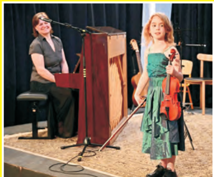
Jarní koncert jinecké pobočky ZUŠ