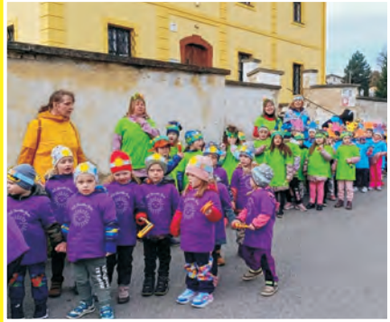
Vítání jara - MŠ Jince