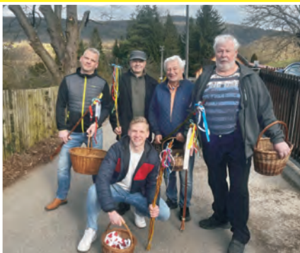
Velikonoce v Rejkovicích