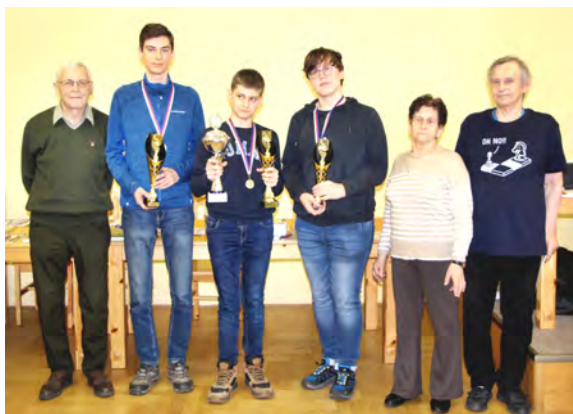
Vítězové a hlavní organizátoři