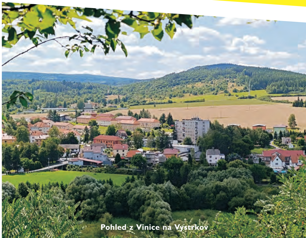
Pohled z Vinice na Vystrkov