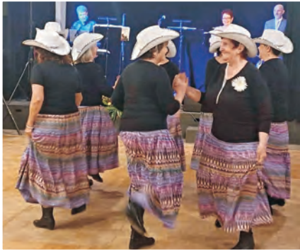
Obecní ples - Dupačky