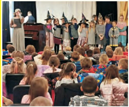
Z Pohádky do pohádky - koncert ZUŠ pro děti