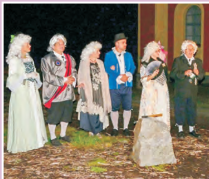
Noc v Barboře