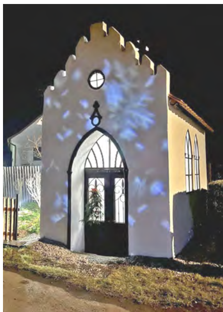
Kaplička v Rejkovicích

V tomto roce se naposledy sejdeme 24. prosince po večerní pohádce. Zveme Vás na ŠTĚDROVEČERNÍ ZPÍVÁNÍ u kapličky v Rejkovicích.