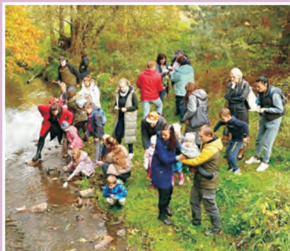
Večer sokolských světél