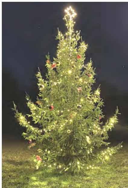
Vánoční strom 2024