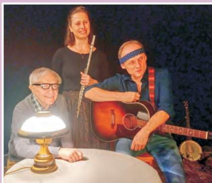
Jak vypřáhnout mezka