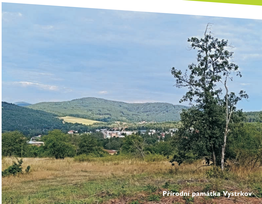
Přírodní památka Vystrkov