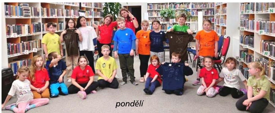
Foto z akce najdete pěkně pohromadě na našem knihovnickém úložišti: https://knihovna-jince.rajce.idnes.cz

spáním. Týden utekl velice rychle, nikomu se nic nestalo, dle dětí se všem moc líbilo, a to je nejdůležitější. Ještě jednou díky všem, kteří se na zdárném průběhu akce podíleli.