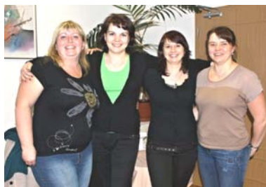
Bývalé předsedkyně na snímku z roku 2016