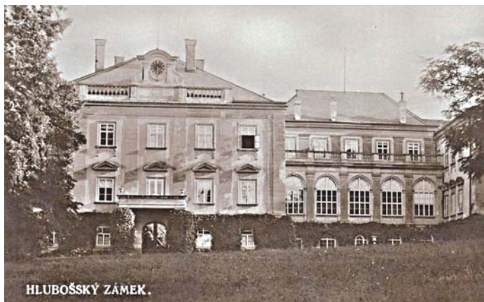
Zámek na historické pohlednici

hlubošský kostelík Nejsvětější Trojice, viditelný z dalekého okolí, pochopí. Vždy, když jedu z Příbrami do Jince, mi pohled na kostelík zlepší náladu. V dávných dobách zde stávala pohanská svatyně. Pod kostelem, na místě dnešního zámku, již v 10. století stávala opevněná dřevěná tvrz. Vystavili ji asi Slavníkovci a její osádka chránila místní před přepady loupeživých tlup. Slavníkovci byli v 10. století