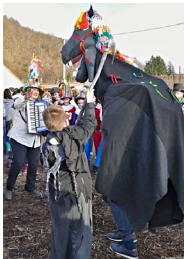
Fotoalba: https://1url.cz/o16dY https://1url.cz/61xC0