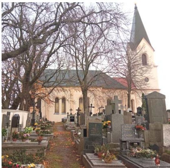
Kostel se hřbitovem

Hluboš - ves nad Litavkou, brána staré karavanní stezky. V literatuře jsem se dočetl, že jméno Hluboš je odvozeno od slova „hlubov“ - hluboký nebo snad „lubov“ - líbivý. Každý, kdo se zadívá na