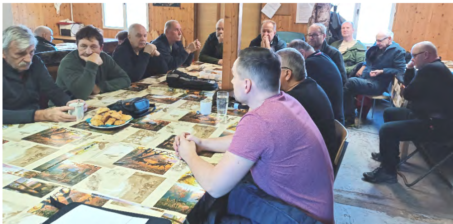
Z jednání výroční členské schůze