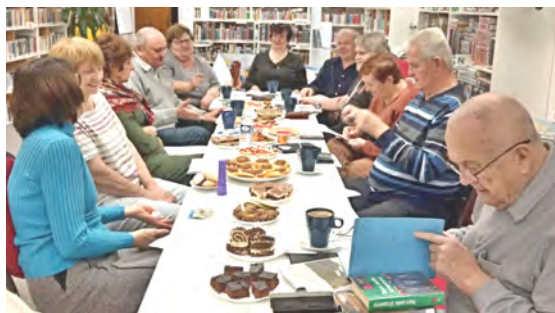
Studenti VU3V na přednášce

V současné době probíhá 3. semestrální kurz na námi zvolené téma „České dějiny a jejich souvislosti II“. Pro pokračování tohoto tématu jsme se rozhodli jednohlasně, neboť ne nadarmo se říká: „Kdo nezná své dějiny, jako by nebyl.“