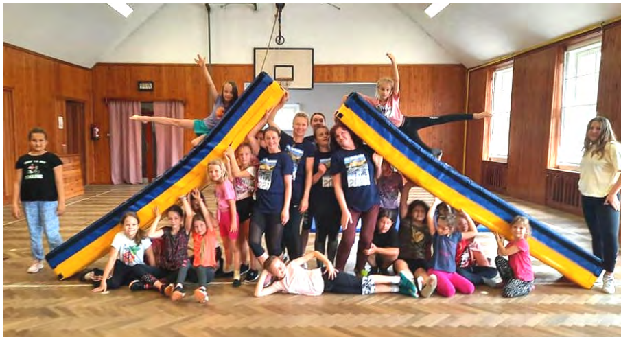
Členky jineckého Sokola.