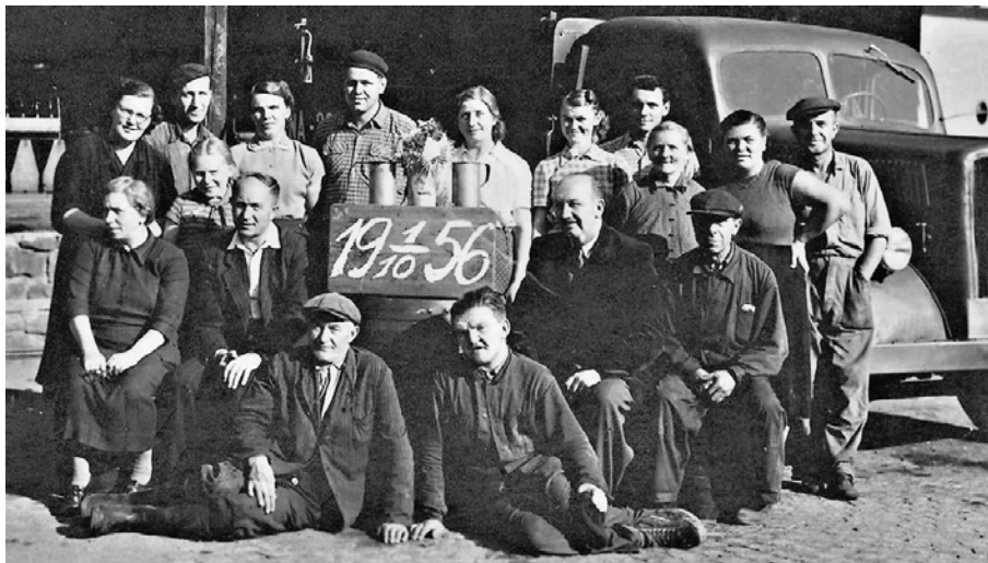
Zaměstnanci Brdského pivovaru, n. p. v roce 1956.

Roku 1964 vypukl v objektu požár, při kterém byla zničena většina zachovalých malovaných stropů ze 17. století ve starší části objektu.