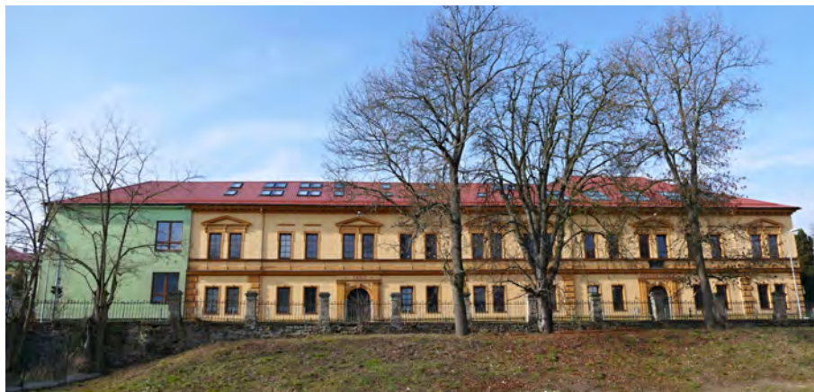
Volební okrsky 1 a 2 se nacházejí v budově Základní školy Jince.