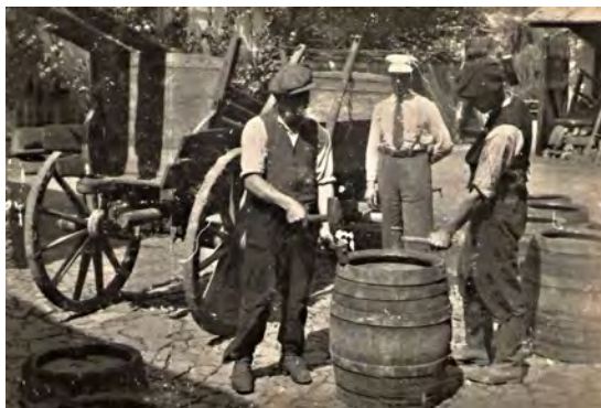
Dělníci jineckého pivovaru

V popsané podobě pak sloužil objekt jako pivovar bez podstatných změn. Od počátku 20. století se začínají ve znaleckých posudcích opakovat upozornění na nevhodnost pivovarského využití, jak pro osud kdysi výstavného zámku, tak pro rentabilitu výrobního podniku. Roku 1904 se prováděla větší údržba opotřebovaných stavebních prvků.