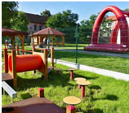
Zázemí družiny a dětské hřiště

1. září se také otevřely dveře KOMUNITNÍHO CENTRA , kam se přestěhovala i jinecká KNIHOVNA .