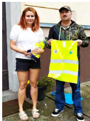
Reflexní vesty jsme předali také do MŠ Čenkov