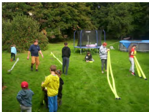
První schůzka malých hasičů