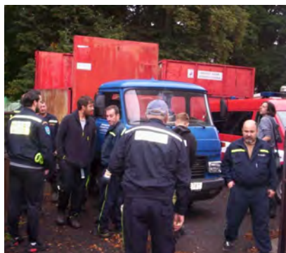
Sběr železného šrotu