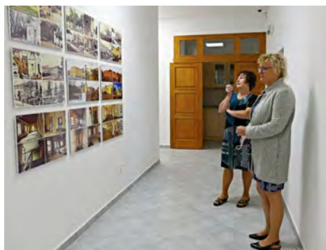
Prostory komunitního centra s knihovnou

Reportáže Pribram24.cz o zahájení školního roku a z předání bytů najdete na Facebooku „Městys Jince“