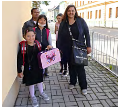
Cesta prvňáčků do školy