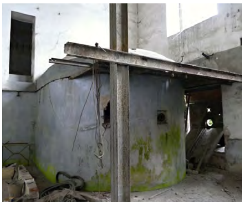
Prostory bývalého pivovaru – sladovna a varna.