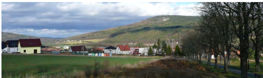
Lokalita Na Vyhlídce