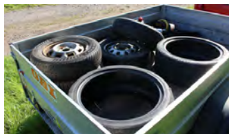
Výbor ČRS, z. s., MO Jince

Tento prostor naučné stezky využívají osoby, kteří jdou od Jince do Čenkova a zpět k zastávce a k relaxaci u splavu na říčce Litavce. Nějaký „dobrák“ v tomto prostoru uložil čtyři pneumatiky s disky a dvě pneumatiky a založil černou skládku, kterou odstranil předseda.