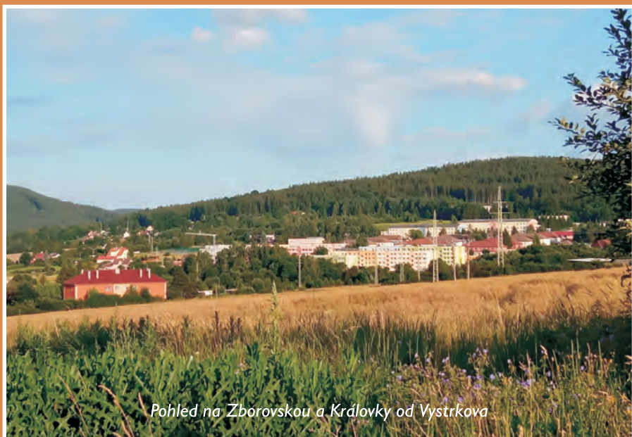
Pohled na Zborovskou a Královky od Vysrkova