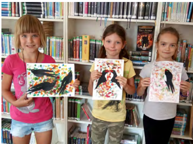
Výtvarná dílna na podzimní téma „Vlaštovky“

Několik dalších fotografií: https://knihovna-jince.rajce.idnes.cz/Vytvarna_dilna_dne_8_9_2021_-_tema_Vlastovky/