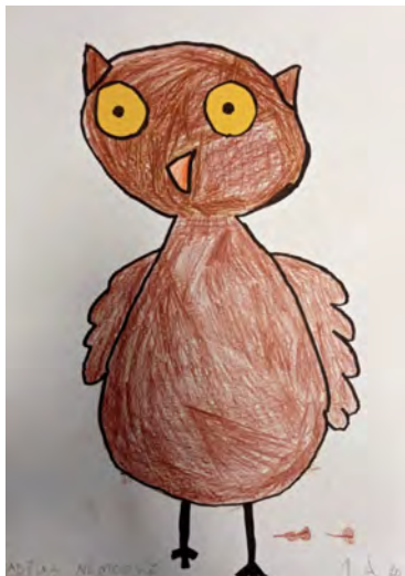
Jedna z vyhodnocených prací