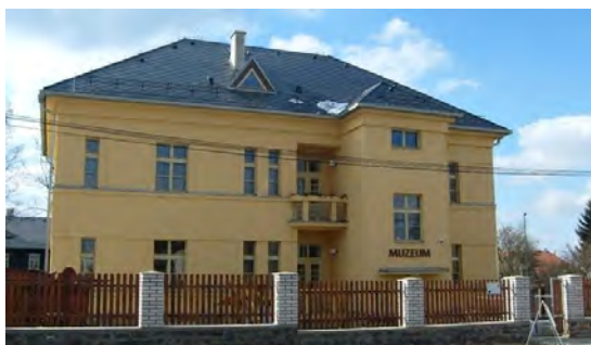
Muzeum Středních Brd ve Strašicích.